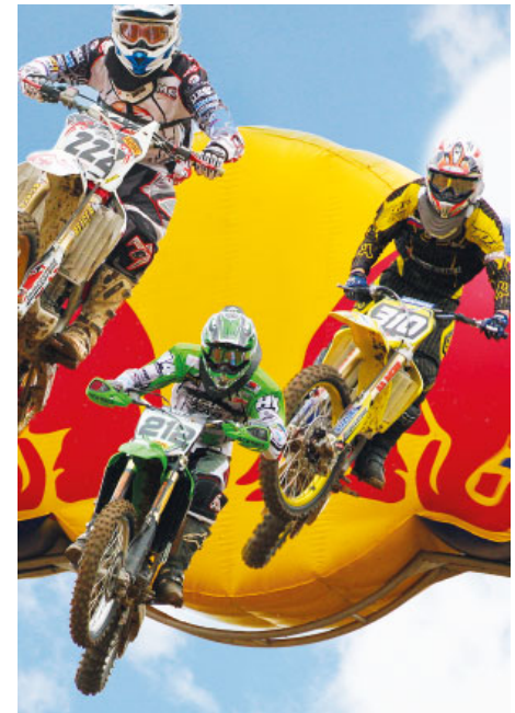
Beispiel Action Fotografie, Instagram Story